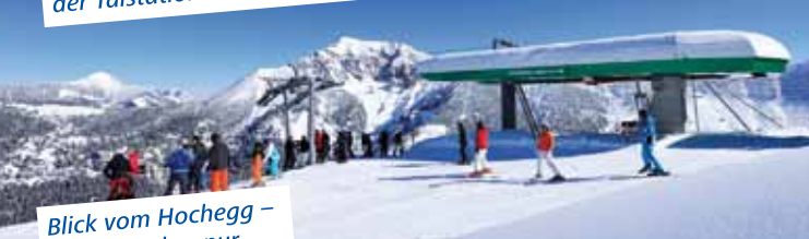
Blick vom Hohegg – Winterzauber pur.