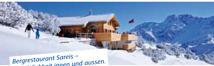
Bergrestaurant Sareis – Gemütlichkeit innen und aussen.