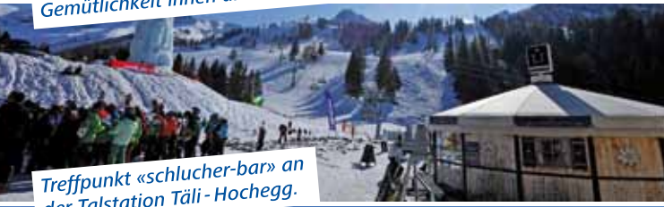
Treffpunkt «schlucher-bar» an der Talstation Täli-Hohegg.